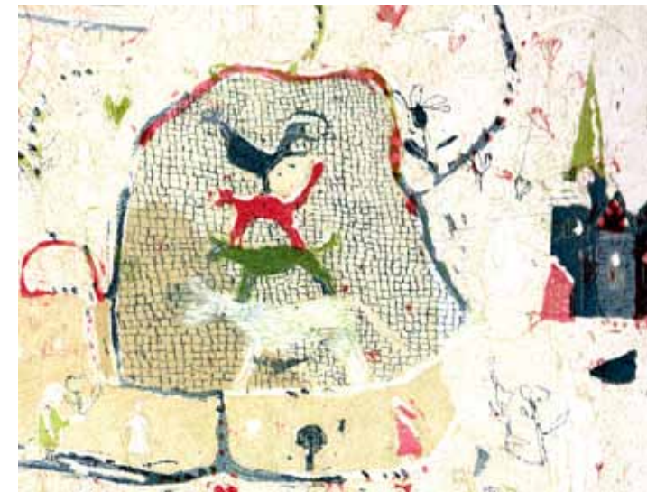
Falko Behrendt: „Jubiläumskonzert“, Farbradiierung (Ausschnitt)